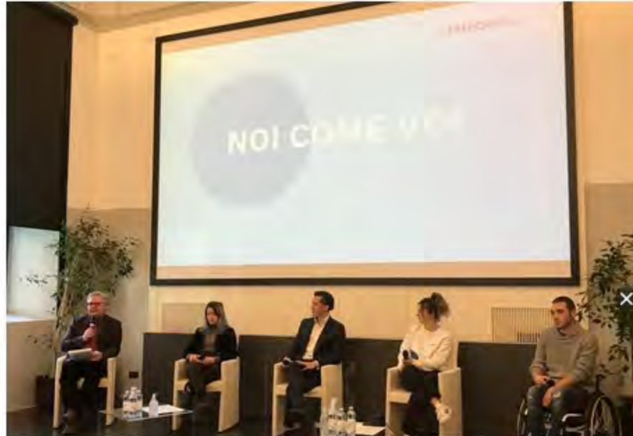
- RIPRODUZIONE RISERVATA